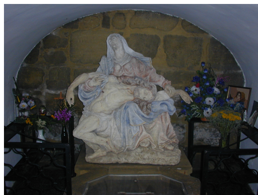
Pieta in der Bründlkapelle in Maria Moos